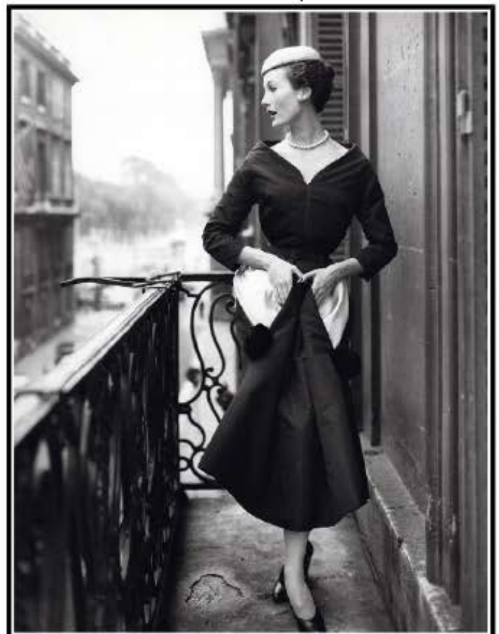
Cliché réalisé pour le couturier Jean Patou