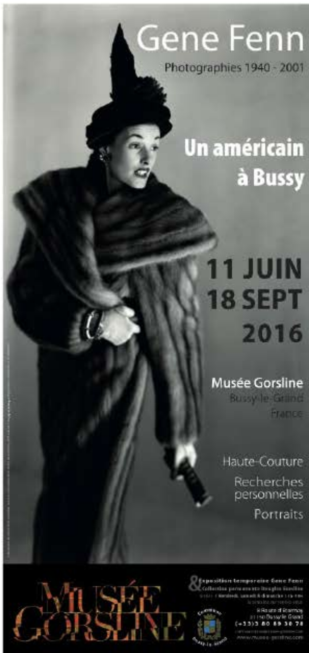
L'affiche de l'exposition

Nouvelle exposition du 11 juin au 18 septembre 2016