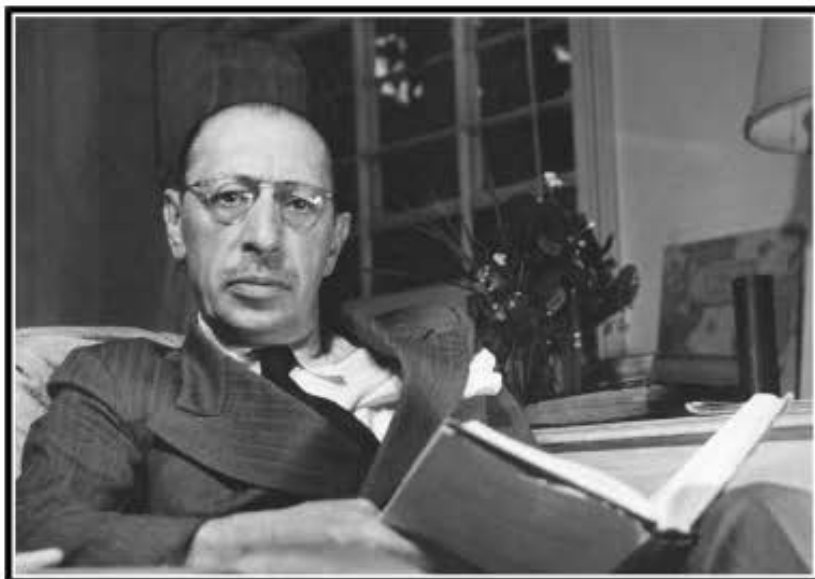
Igor Stravinsky, 1948