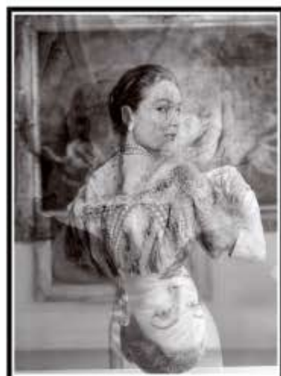
"Photo-peinture intégrée" inspirée par la peinture de Douglas Gorsline