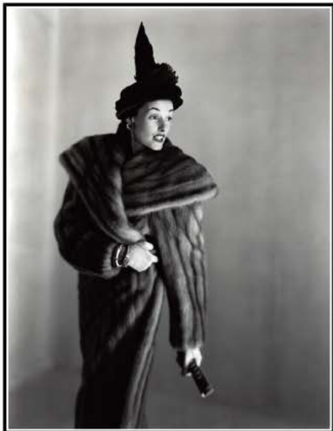
Shooting pour une fourrure