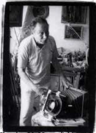
Chambre 20x25 avec l'objectif de prise de vue aérienne 3056/ 2.8.

Comme une histoire américaine débute toujours par une anecdote, voici celle qui propulsa le jeune Gene Fenn sur le chemin de son destin.